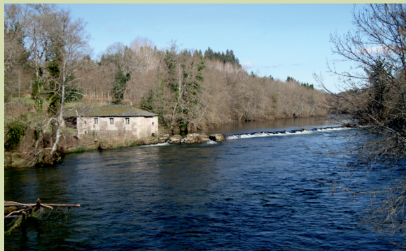
Muiño da Ponte e caneiro no río Ladra, entre Outeiro de Rei e Begonte