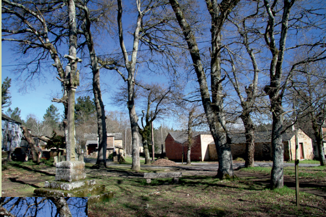
A Feira (Gaioso, Outeiro de Rei)